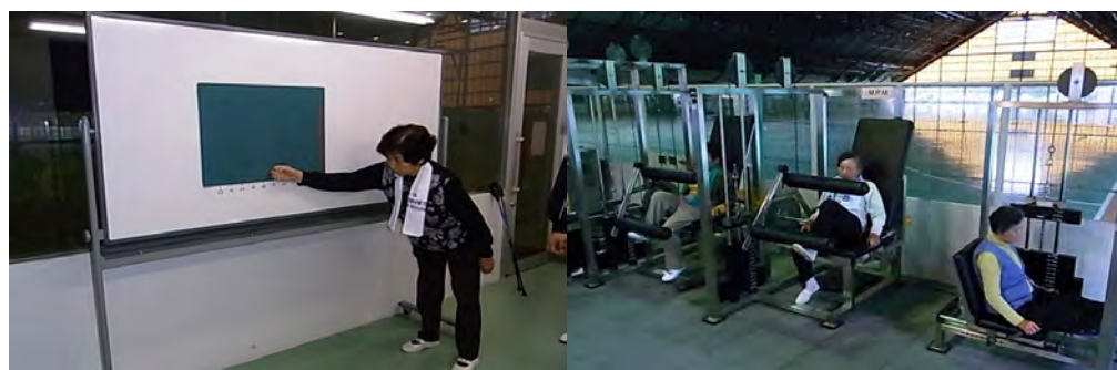
特定高齢者への筋力トレーニング

地元行政とも連携し、特定高齢者への筋力トレーニング指導等を行い、健康増進事業を推進する。