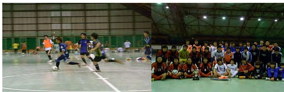
地域スポーツ振興にフットサル大会を開催

本センターの多目的ホールを会場に、伊豆地域の小学生・中学生及び一般を対象にしたフットサル大会を開催するとともに、地元行政やサッカー協会との連携のもと「CSCフットサル夏季リーグ&秋季リーグ」を新設するなど、フットサルを通じて地域スポーツの振興を図る。