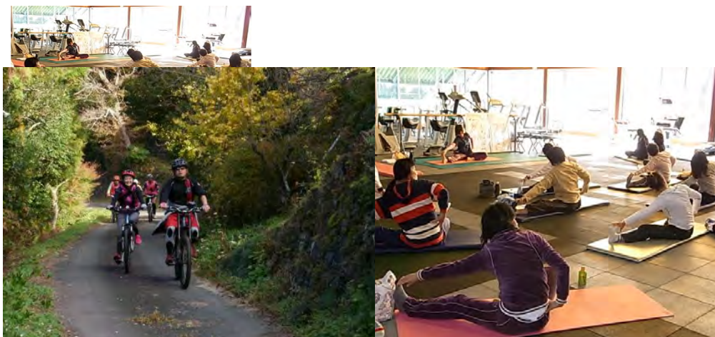
自転車体験プログラム 紅葉サイクリング